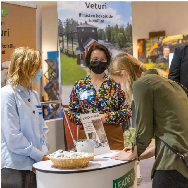
Kuva 3. Toiminnanjohtaja ja hankeneuvoja esittelevät Veturin toimintaa By lisalmi -tapahtumassa.