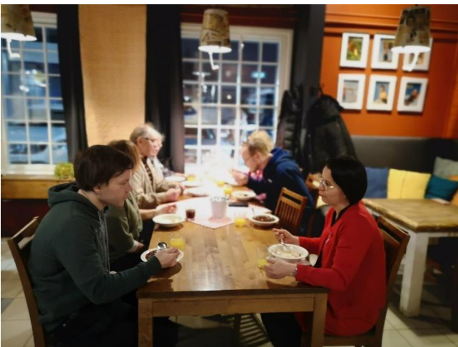
Kuva 1. Jäsenille ja sidosryhmille järjestetty joulupuurotilaisuus.

Vuoden 2021 lopussa Veturin kokonaisjäsenmäärä oli 190, joista jäsenmaksun maksaneita 147 (77 %). Organisaatiojäseniä oli 115 ja yksityisiä 71. Kuusi jäsentä erotettiin kolmen vuoden peräkkäisen jäsenmaksulaiminlyönnin vuoksi ja kolme jäsentä irtisanoutui itse. Jäsenmäärä laski edellisvuodesta 3 jäsenen verran. Jäsenille lähetettiin Veturitiedote kahdesti sähköisenä ja kahdesti kirjepostilla. Jäsenmaksut lähetettiin maaliskuussa ja maksamattomille vielä uudelleen lokakuussa. Veturin vuonna 2019 aloitettu joulupuurotarjoilu jäsenille toteutettiin Iltalypsyn kokoustilassa Iisalmissa ja siellä kävi noin 30 jäsentä tai sidosryhmän edustajaa.