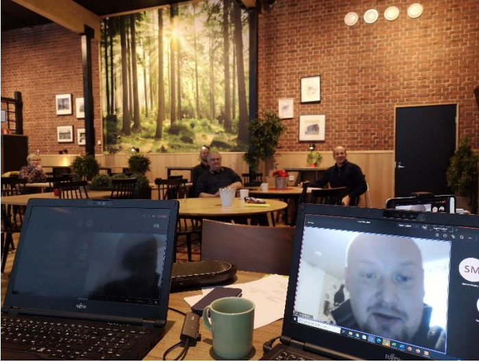
Kuva 2. Veturin syyskokous Sukevalla hybridinä.

Yhdistyksen kevätkokous pidettiin 29.4. lisälomassa ja syyskokous Sonkajärven Sukevalla 25.11. Molemmissa kokouksissa kuultiin hanke-esittelyjä.