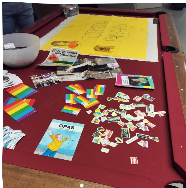
Kuva: Foorumin materiaalia nuorille jaettavaksi

Nuoriso Foorumit ovat osa Ylä-Savon Veturin Elä nuku! - hankkeen konkreettista toimintaa, jossa tavoitteena on saattaa yläsavolaiset nuoret, nuorisotoimijat sekä kuntapäätäjät yhteen sekä lisätä yhteistyötä heidän välillään.