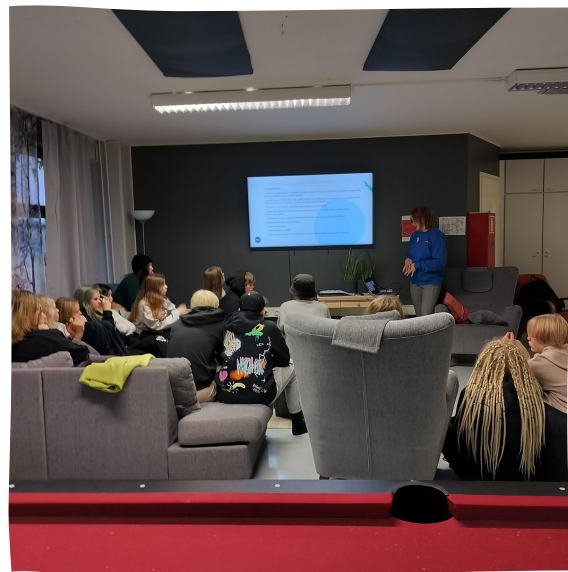
Kuva: Ensimmäinen nuorten työpaja

Pyrin tuomaan vahvasti esillä sitä, että jokainen on hyvä ja täydellinen juuri sellaisena kuin on. Seksuaalisuutta on ihminen kokonaisuudessaan ja seksuaalisuus on matka itseen, joka jatkuu koko elämän ajan. Keskustelua heräsi hieman. Hyvä kommentti oli: "voisiko riittää, jos olisimme ihmisiä, emmekä tarvitsisi määritellä seksuaalisuuden tai sukupuolen perusteella muita/itseämme?"