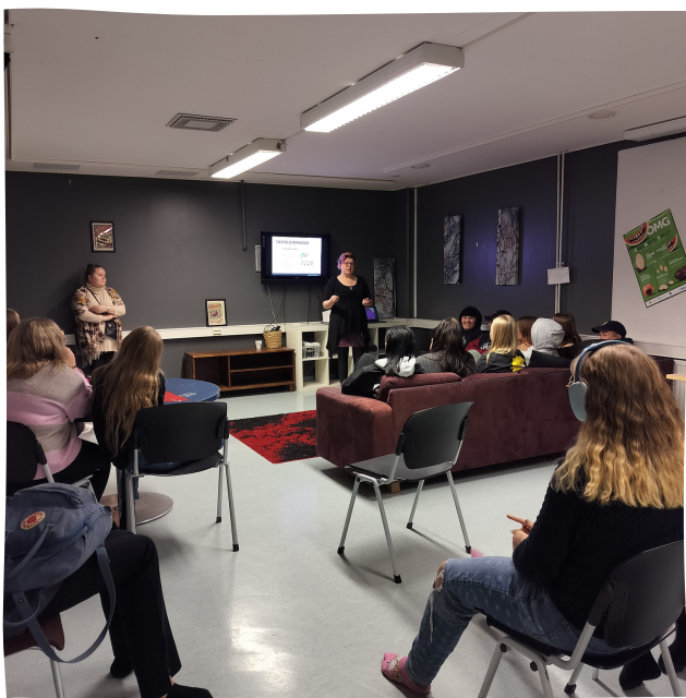
Kuva: Ensimmäisestä työpajasta

Ilta alkoi tervetuliais sanoilla sekä illan ohjelman esittelyllä. Aikuiset myös esittelivät itsensä. Ennen työpajojen alkamista, tehtiin yhdessä matalan kynnyksen draamaharjoitus "moikka - peli". Tässä tavoitteena oli herättää osallistujat tutkimaan ja katsomaan keitä kaikkia Foorumiin oli saapunut, kuinka montaa tunti entuudestaan, kuinka moni vieraita kasvoja sekä matalalla kynnyksellä moikkailemaan toisille.